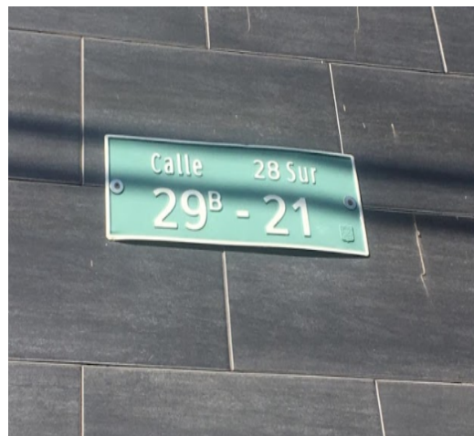
FOTOGRAFIA N°. 2 NOMENCLATURA DEL PREDIO