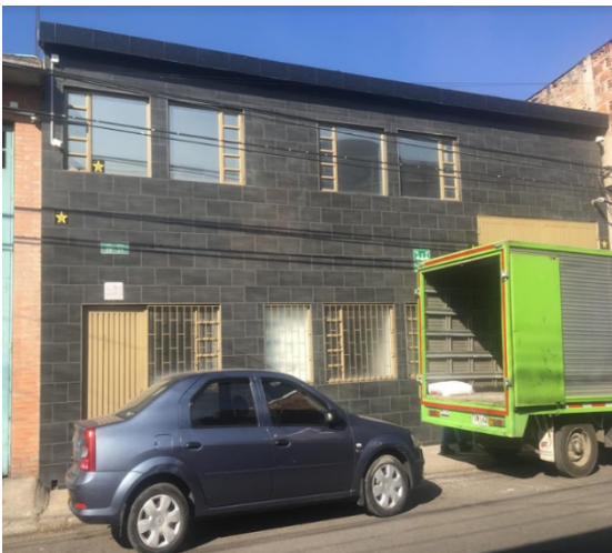
FOTOGRAFIA N°. 1 FACHADA DEL PREDIO.